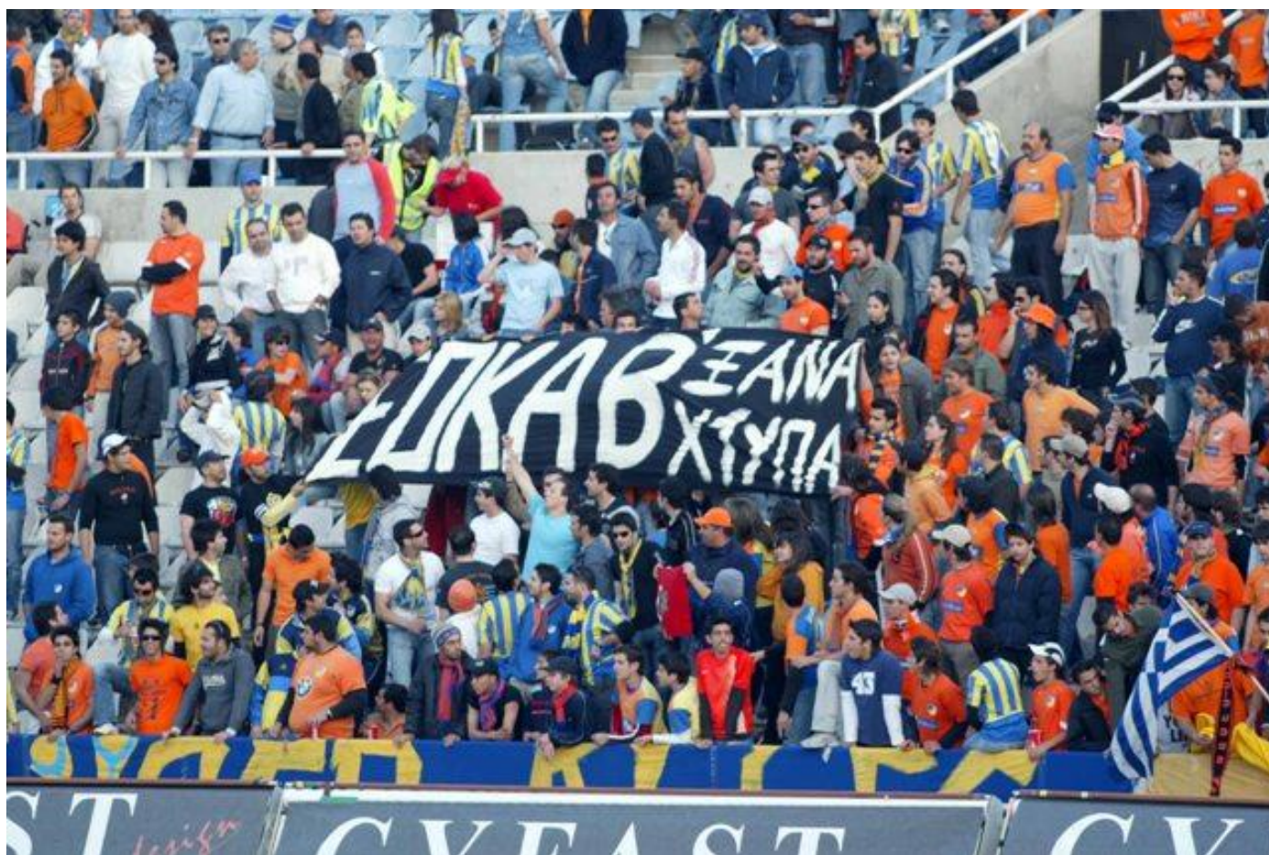
Οπαδοί του ΑΠΟΕΛ σηκώνουν πανό υπέρ της ΕΟΚΑ Β κατά την διάρκεια αγώνα.